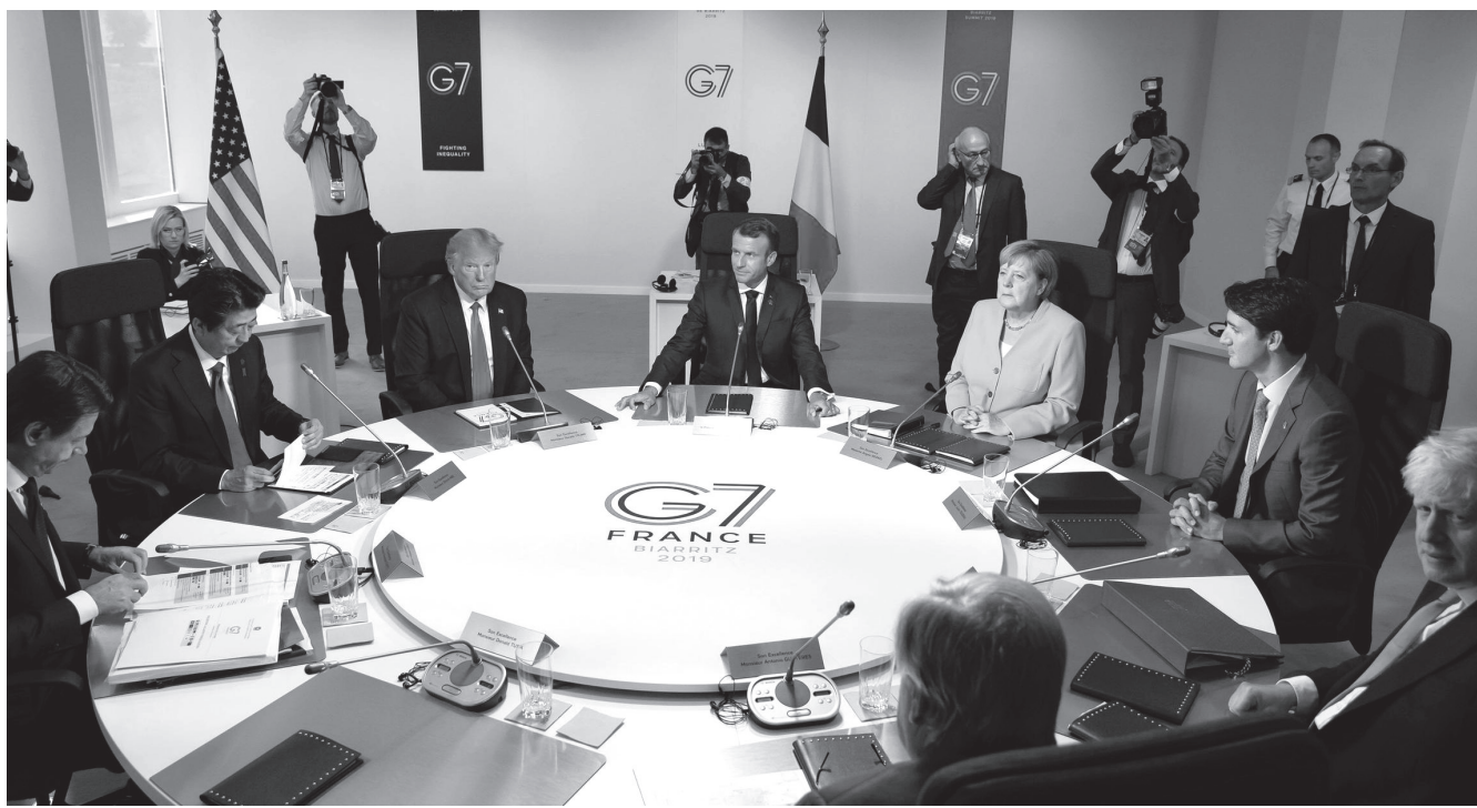
Még a válsághelyzet előtt: a G7 biarritzi csúcstalálkozója, 2019. augusztus 24–26.

nem volt szándékában a nemzetközi válaszlépések élére állni. Így a brit tisztviselők feladták a reményt... Mivel az európaiak teljesen elhidegültek az Egyesült Államoktól, a G7 gyakorlatilag megszűnt létezni.