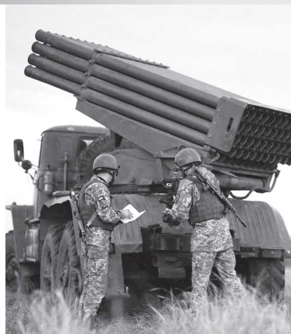
Orosz-ukrán konfliktus. Mindkét fél készül az esetleges összecsapásokra

lenti: új világrendet akar Oroszország és Kína. 1 A következőkben ebből az írásból következik egy hosszabb idézet, amely jól összefoglalja a konfliktus valódi tétjét: